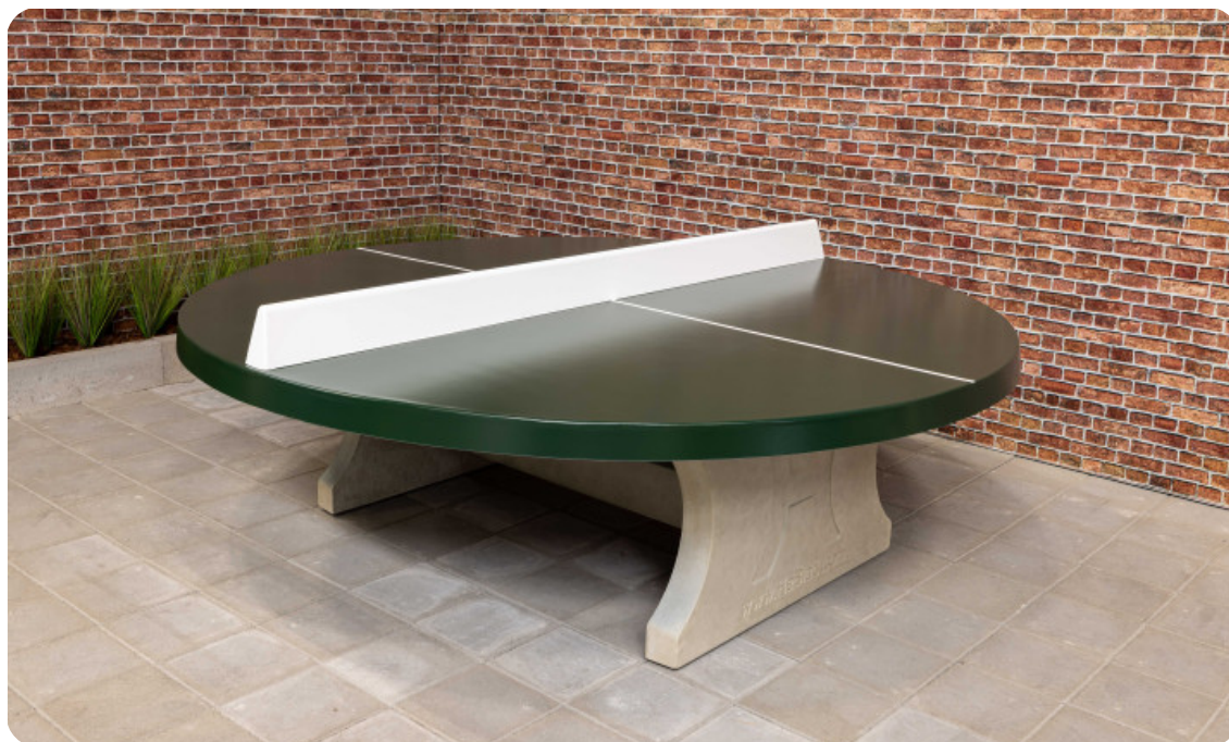
Table de ping-pong verte ronde