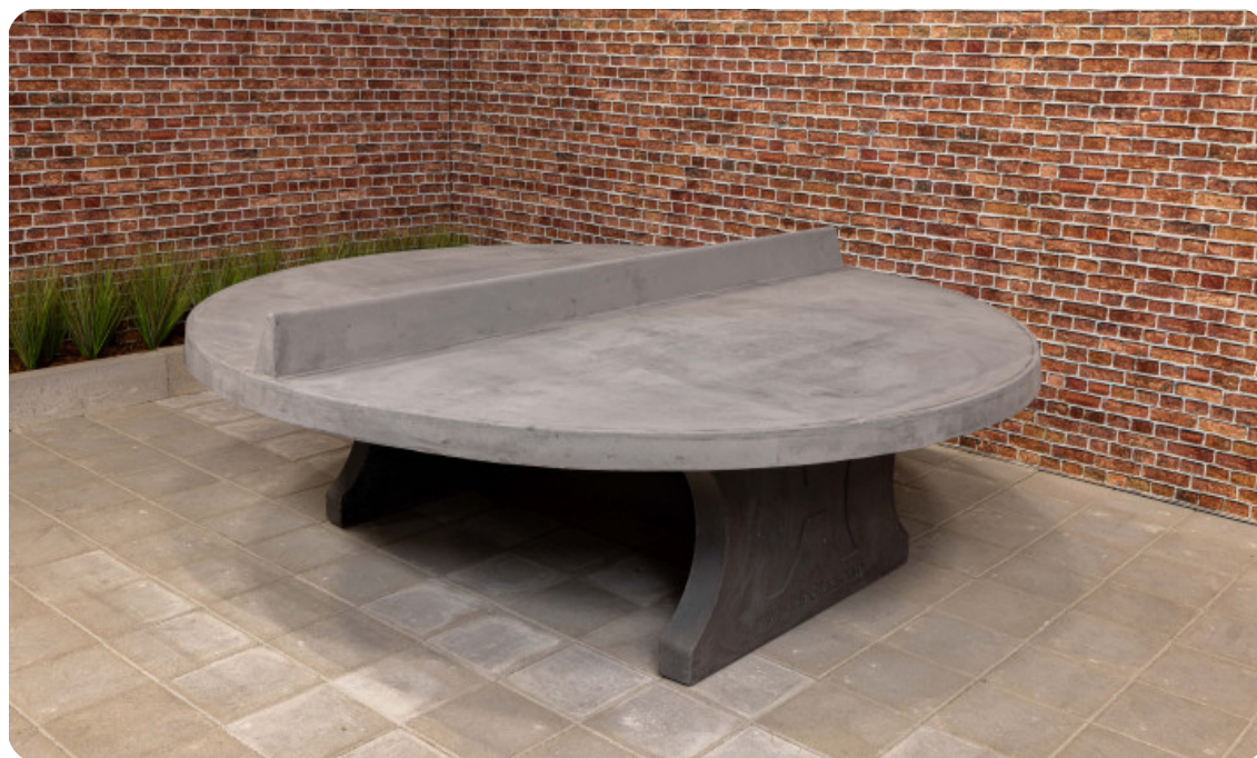
Table de ping-pong béton-anthracite ronde