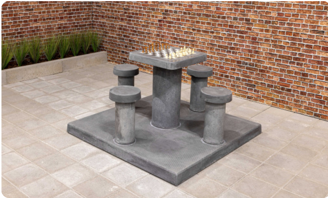
Table d'échecs en béton anthracite, 4 personnes