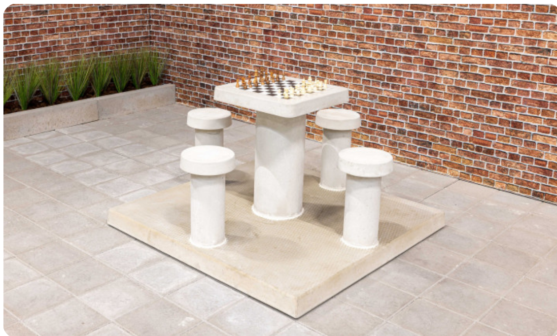
Table d'échecs en béton naturel, 4 personnes